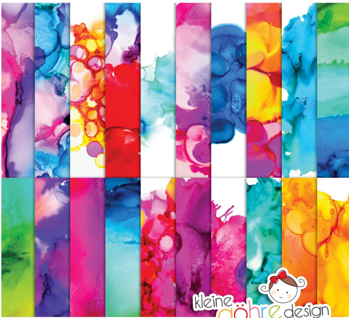
digitale Papiere "Farbexplosion Muster 3"