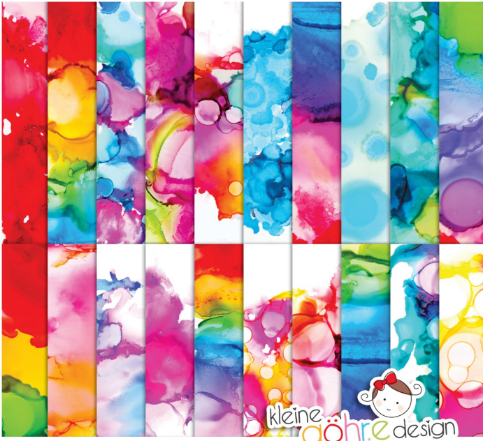
digitale Papiere "Farbexplosion Muster 1"