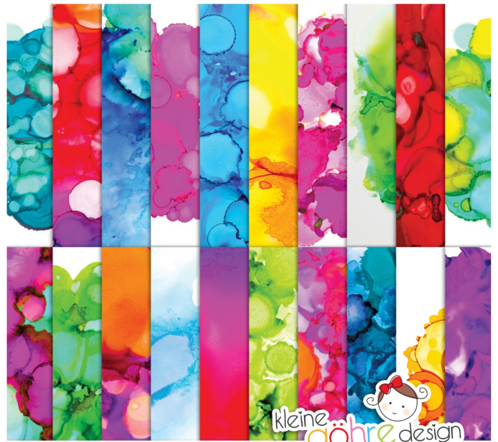
digitale Papiere "Farbexplosion Muster 4"